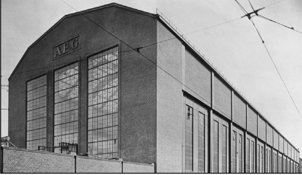
AEG Türbin Fabrikası, Berlin