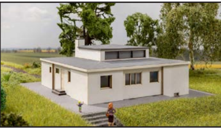
Haus am Horn

Bir süre Weimar Cumhuriyeti'ne de başkentlik yapmış Weimar, birçok önemli insanın yolunun geçtiği bir şehir olmuş. Weimar, Bauhaus'un kurulduğu yer olmasıyla oluşturulan rotanın en önemli noktalarından. Kandinsky, Van de Velde, Gropius gibi sanatçı ve tasarımcıları ağırlayan Weimar, Goethe ve Schiller'in de doğum yeri.