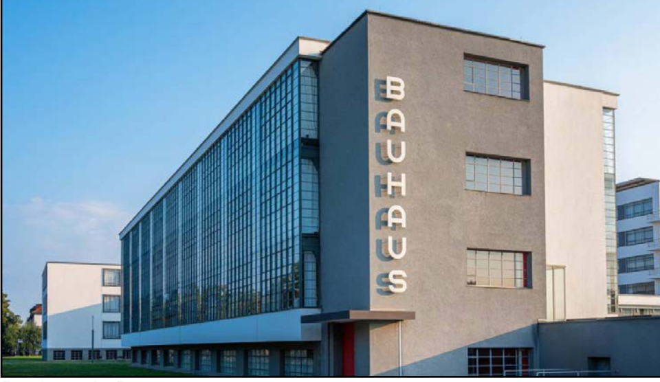
Bauhaus in Dessau