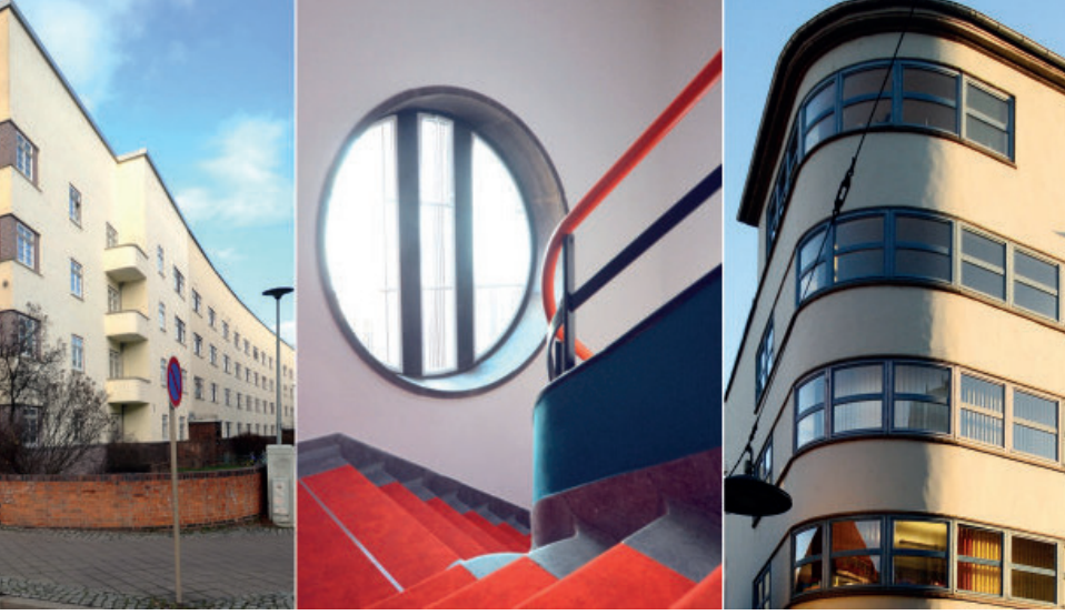
Erfurt, Bauhaus Modernleri