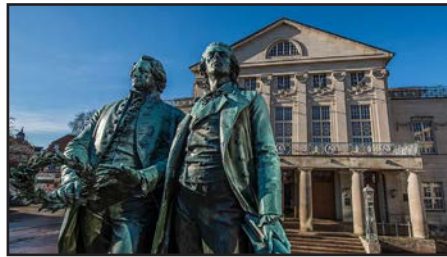
Goethe ve Schiller, Weimar