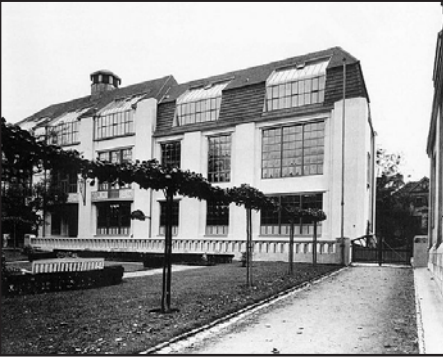
Bauhaus in Weimar

Erfurt'ta zengin bir Bauhaus mirası bulunmaktadır. Bunlardan bazıları: Haus am Anger, Geschäftshaus, Sparkasse am Anger, Hansa Block, Katholische Krankenhaus ve sanat koleksiyonu için Angermuseum.