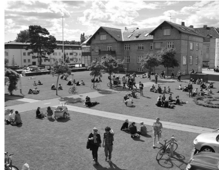
royal danish academy of fine arts