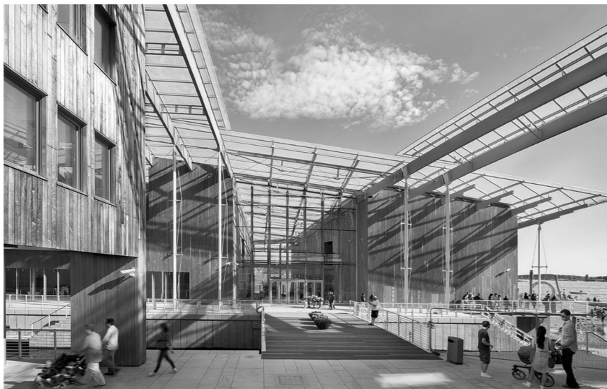
astrup fearnly museum