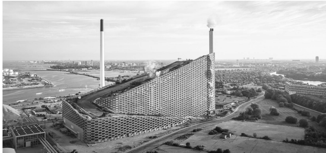
copenhill energy plant